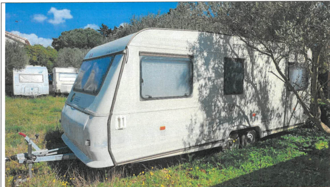
Fotografije počitniške prikolice